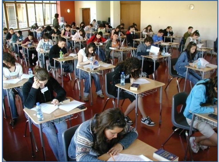
Over 50 students applied for Full scholarship.

May 29, 2007 , 10:30 am The Anglo-American School of Sofia officially awarded the most successful Bulgarian students with full three to four year scholarships for the amount of 60 000 Euro for each student.